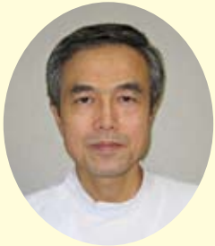
越谷誠和病院 院長