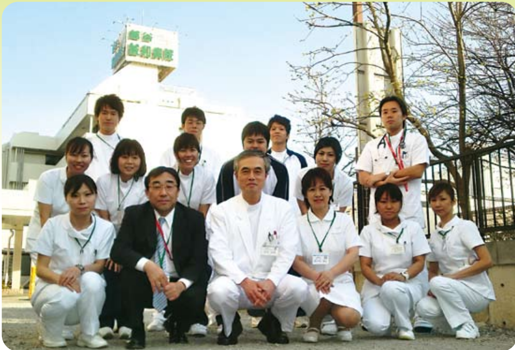
平成23年度新入職員と病院三役