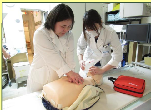
◀ 研修風景 ▶